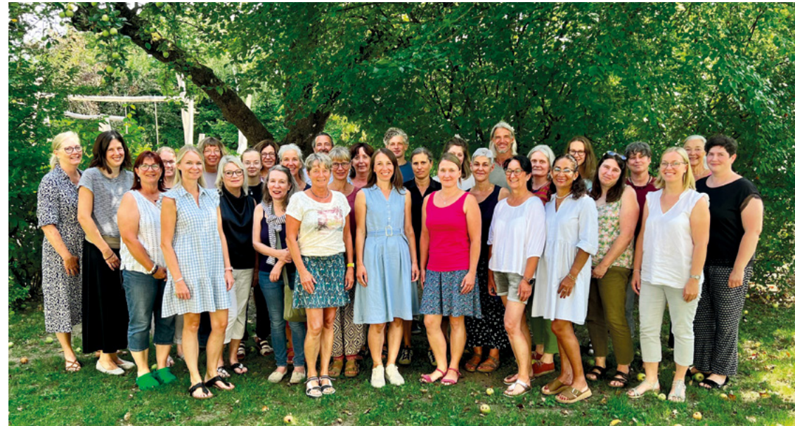
Pädagogisches Team und Schulverwaltung der Montessori-Schule Geisenhausen

Wir freuen uns auf jedes Kind und deren Eltern, die Teil unserer Montessori-Familie werden wollen. Für Ihre Fragen stehen wir gerne zur Verfügung!